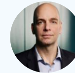
Jens Skriver Virksomhedsobligationer